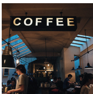
Industrie de l'accueil